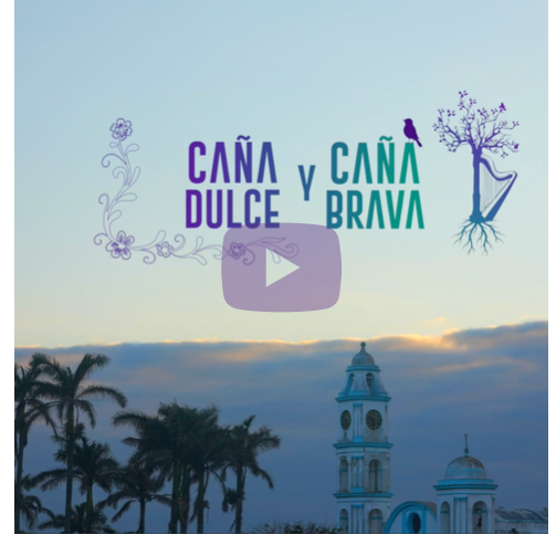
Video de un minuto