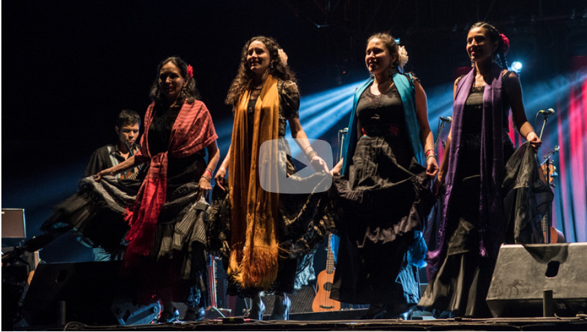
Video en vivo en gran escenario